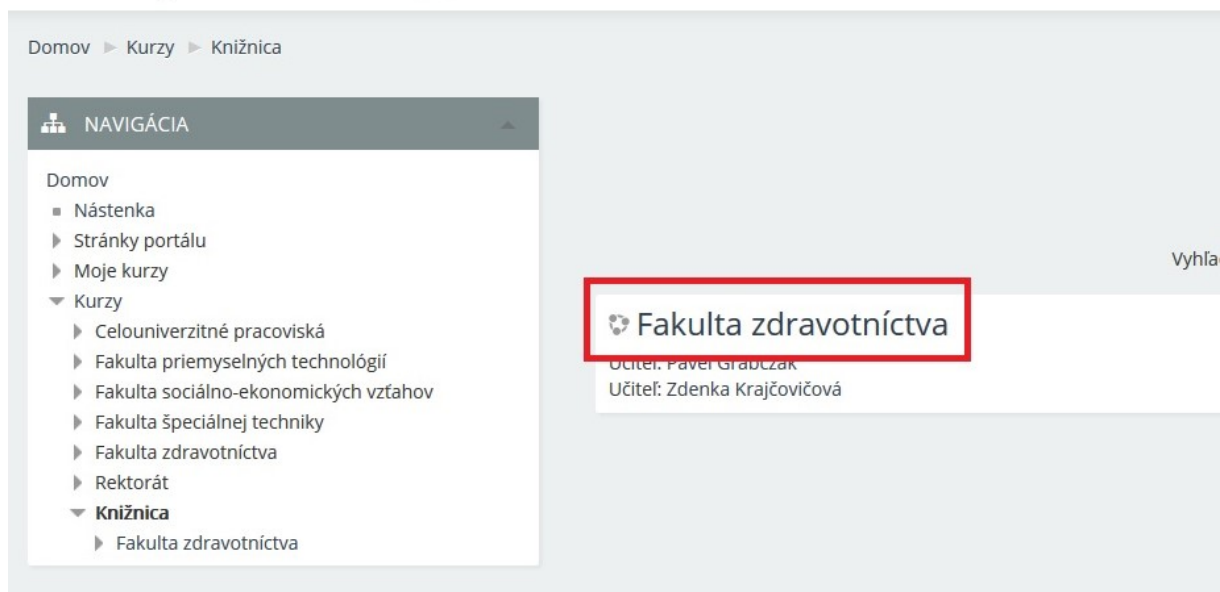
Obr. 2. Následne prosím vyberte položku Fakulta zdravotníctva (ak ste tu ešte neboli stlačte prihlásenie sa do kurzu).